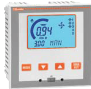
DCRL 3 - DCRL 5