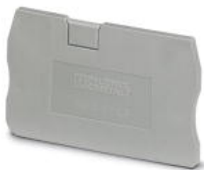
Tapa final, longitud: 48,6 mm, anchura: 2,2 mm, altura: 29,1 mm, color: gris

Tenga en cuenta que los datos indicados aquí proceden del catálogo en línea. Los datos completos se encuentran en la documentación del usuario. Son válidas las condiciones generales de uso de las descargas por Internet. ( http://phoenixcontact.es/download )