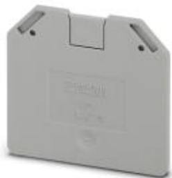
Tapa final, longitud: 52,8 mm, anchura: 2,2 mm, altura: 47,3 mm, color: gris

Tenga en cuenta que los datos indicados aquí proceden del catálogo en línea. Los datos completos se encuentran en la documentación del usuario. Son válidas las condiciones generales de uso de las descargas por Internet. ( http://phoenixcontact.es/download )