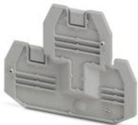
Tapa final, longitud: 69,9 mm, anchura: 2,2 mm, altura: 57,5 mm, color: gris

Tenga en cuenta que los datos indicados aquí proceden del catálogo en línea. Los datos completos se encuentran en la documentación del usuario. Son válidas las condiciones generales de uso de las descargas por Internet. ( http://phoenixcontact.es/download )