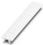
Tira Zack, disponible: Tiras, blanco, rotulado según las indicaciones del cliente, clase de montaje: encajar en ranura para índice alta, para ancho de borne: 6,2 mm, superficie útil: 6,15 x 10,5 mm

Tira Zack - ZB 6,LGS:FORTL.ZAHLEN - 1051016