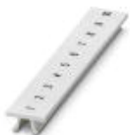
Tira Zack, Tiras, blanco, rotulado, rotulable con: CMS-P1-PLOTTER, rotulación longitudinal: números correlativos de 1 ... 10, 11 ... 20 etc. hasta 491 ... 500, clase de montaje: encajar en ranura para índice alta, para ancho de borne: 6,2 mm, superficie útil: 6,15 x 10,5 mm

Tira Zack - ZB 6,LGS:FORTL.ZAHLEN - 1051016