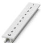
Tira Zack, Tiras, blanco, rotulado, rotulable con: CMS-P1-PLOTTER, Rotulación transversal: números correlativos de 1 ... 10, 11 ... 20 etc. hasta 491 ... 500, clase de montaje: encajar en ranura para índice alta, para ancho de borne: 6,2 mm, superficie útil: 6,15 x 10,5 mm

Tira Zack - ZB 6,QR:FORTL.ZAHLEN - 1051029