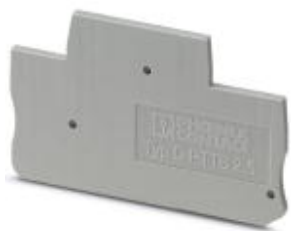
Tapa final, longitud: 68 mm, anchura: 2,2 mm, altura: 39,6 mm, color: gris

Tenga en cuenta que los datos indicados aquí proceden del catálogo en línea. Los datos completos se encuentran en la documentación del usuario. Son válidas las condiciones generales de uso de las descargas por Internet. ( http://phoenixcontact.es/download )