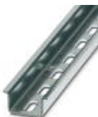
Carril simétrico perforado, Perfil estándar, anchura: 35 mm, altura: 15 mm, similar EN 60715, material: Acero, Galvanizado, pasivado blanco, longitud: 2000 mm, color: plateado

Carril simétrico perforado - NS 35/15 WH PERF 2000MM - 0806602