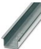
Carril simétrico sin perforar, Perfil estándar, anchura: 35 mm, altura: 15 mm, similar EN 60715, material: Acero, Galvanizado, pasivado blanco, longitud: 2000 mm, color: plateado

Carril simétrico sin perforar - NS 35/15 WH UNPERF 2000MM - 1204135