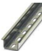
Carril simétrico perforado, Perfil estándar, anchura: 35 mm, altura: 15 mm, similar EN 60715, material: Acero, galvanizado, pasivado de capa gruesa, longitud: 2000 mm, color: plateado

Carril simétrico perforado - NS 35/15 PERF 2000MM - 1201730