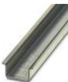
Carril simétrico sin perforar, Perfil estándar, anchura: 35 mm, altura: 15 mm, similar EN 60715, material: Acero, galvanizado, pasivado de capa gruesa, longitud: 2000 mm, color: plateado

Carril simétrico sin perforar - NS 35/15 UNPERF 2000MM - 1201714