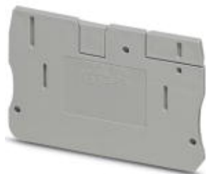
Tapa final, longitud: 57,7 mm, anchura: 2,2 mm, altura: 36 mm, color: gris

Tenga en cuenta que los datos indicados aquí proceden del catálogo en línea. Los datos completos se encuentran en la documentación del usuario. Son válidas las condiciones generales de uso de las descargas por Internet. ( http://phoenixcontact.es/download )