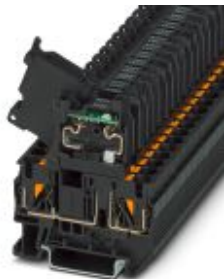
Borne para fusible con palanca, color negro, para cartuchos para fusibles G de 5 x 20 mm, con LED para 250 V AC

Tenga en cuenta que los datos indicados aquí proceden del catálogo en línea. Los datos completos se encuentran en la documentación del usuario. Son válidas las condiciones generales de uso de las descargas por Internet. ( http://phoenixcontact.es/download )