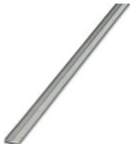
Puente enchufable sin fin, longitud: 500 mm, color: gris

Tenga en cuenta que los datos indicados aquí proceden del catálogo en línea. Los datos completos se encuentran en la documentación del usuario. Son válidas las condiciones generales de uso de las descargas por Internet. ( http://phoenixcontact.es/download )