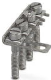
Eslabón puenteador, paso: 8,2 mm, número de polos: 4, color: plateado

Tenga en cuenta que los datos indicados aquí proceden del catálogo en línea. Los datos completos se encuentran en la documentación del usuario. Son válidas las condiciones generales de uso de las descargas por Internet. ( http://phoenixcontact.es/download )