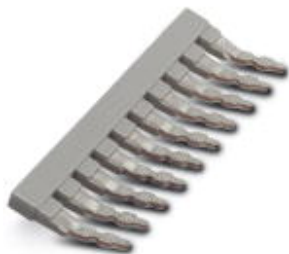
Peine puenteador, paso: 8 mm, número de polos: 10, color: gris

Tenga en cuenta que los datos indicados aquí proceden del catálogo en línea. Los datos completos se encuentran en la documentación del usuario. Son válidas las condiciones generales de uso de las descargas por Internet. ( http://phoenixcontact.es/download )