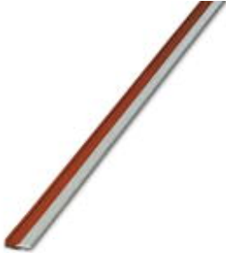
Puente enchufable sin fin, longitud: 500 mm, color: rojo

Tenga en cuenta que los datos indicados aquí proceden del catálogo en línea. Los datos completos se encuentran en la documentación del usuario. Son válidas las condiciones generales de uso de las descargas por Internet. ( http://phoenixcontact.es/download )