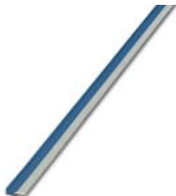
Puente enchufable sin fin, longitud: 500 mm, color: azul

Tenga en cuenta que los datos indicados aquí proceden del catálogo en línea. Los datos completos se encuentran en la documentación del usuario. Son válidas las condiciones generales de uso de las descargas por Internet. ( http://phoenixcontact.es/download )