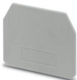
Tapa final, longitud: 61,2 mm, anchura: 1,5 mm, altura: 48,5 mm, color: gris

Tenga en cuenta que los datos indicados aquí proceden del catálogo en línea. Los datos completos se encuentran en la documentación del usuario. Son válidas las condiciones generales de uso de las descargas por Internet. ( http://phoenixcontact.es/download )