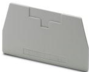
Tapa, longitud: 72 mm, anchura: 2,2 mm, altura: 41,5 mm, color: gris

Tenga en cuenta que los datos indicados aquí proceden del catálogo en línea. Los datos completos se encuentran en la documentación del usuario. Son válidas las condiciones generales de uso de las descargas por Internet. ( http://phoenixcontact.es/download )