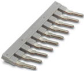
Peine puenteador, paso: 10 mm, número de polos: 10, color: gris

Tenga en cuenta que los datos indicados aquí proceden del catálogo en línea. Los datos completos se encuentran en la documentación del usuario. Son válidas las condiciones generales de uso de las descargas por Internet. ( http://phoenixcontact.es/download )